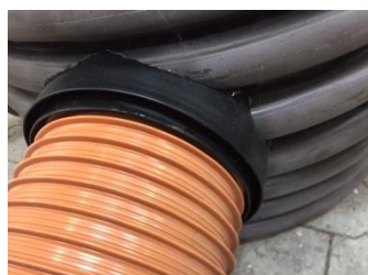
Foto viser et Ultrarør type 1

Pakning B smøres udvendigt med glidemiddel.