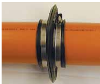
På PVC rør