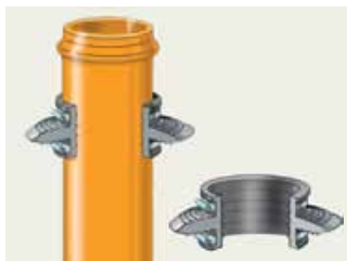
Opbygning af rørgennemføring