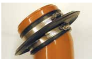
Indmuringsmanchet på rørfittings