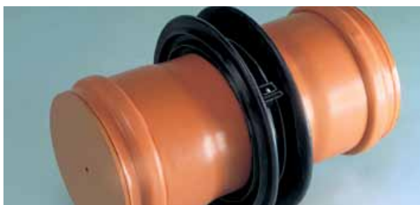
L 972 Rørgennemføringer til murværk

Overalt hvor der føres rør igennem vægge, gulve og murværk forhindrer L 972 rørgennemføringer indtrængende fugt.