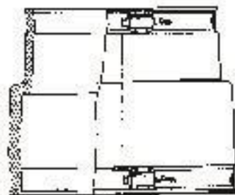
Type AC (Adaptor Coupling)