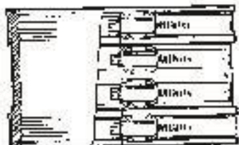
Type SC (Standard Coupling)

I øvrigt henvises til godkendelsesindehaverens katalog.